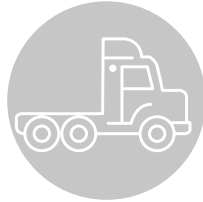
bussen en vracht- -wagen-trekkers