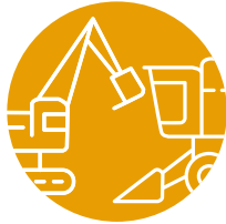
landbouw- en bouwbouwmachines