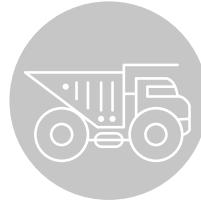
bedrijfs-voertuigen en -machines