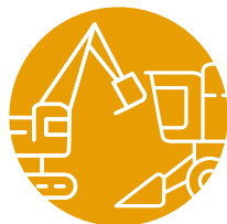
maszyny rolnicze i budowlane