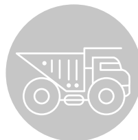
pojazdy i maszyny użytkowe