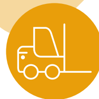
wózki widłowe i podnośniki